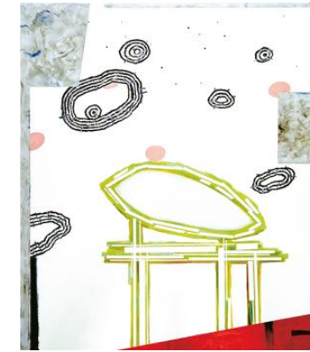
Spherebubbles 2016 olio su tela

Urs Dickerhof Quellgasse 8 – 2502 Biel/Bienne 032 322 91 81 urs.dickerhof.art@bluewin.ch