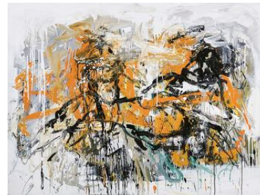
Riposo 2018 olio su tela