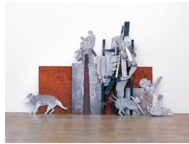
Welcome at Golgatha 1999 struttura in ferro