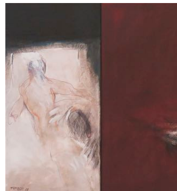
La camera 522 2018 tecnica mista su tela

Klaus Prior Via Maderno 15 – 6900 Lugano 091 922 22 30 klaus.prior@bluewin.ch