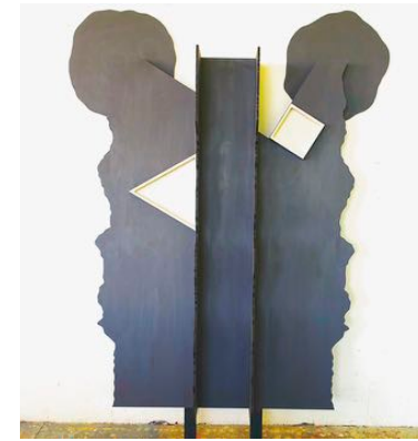
Waiting in the field2 2017 acrilico su MDF