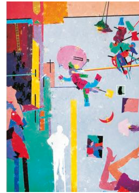
Grazie Roma 1993-96 pittura