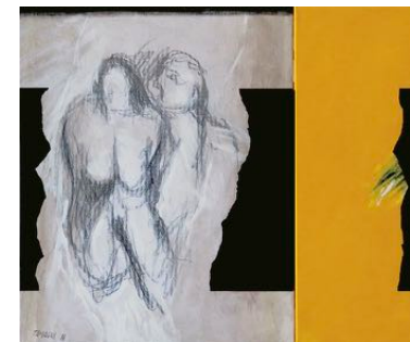
2 Figure 2018 tecnica mista su tela