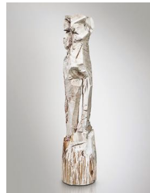
Ohne titel 2016 pappel geweisst

Ruedy Schwyn Egliweg 10 – 2560 Nidau 032 331 02 52 – 079 299 47 39 ru.schwyn@bluewin.ch